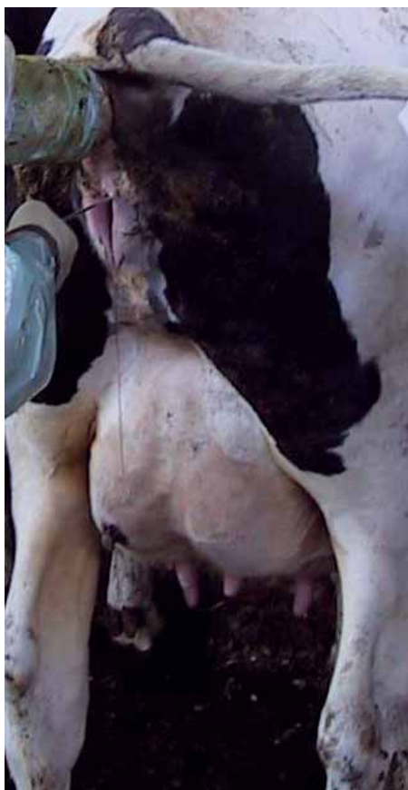
Fuoriuscita di muco al momento della fecondazione artificiale in una bovina in estro