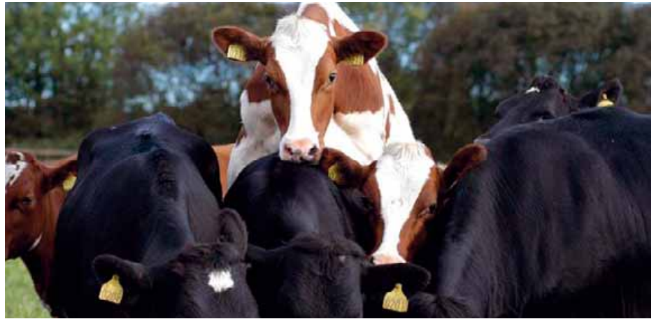
Sintomo di fermo alla monta, entrambe le bovine potrebbero essere in calore, sicuramente lo è quella che rimane ferma mentre viene montata

Innumerevoli sono invece gli attivometri e i podometri disponibili sul mercato, tutti basati sull'impiego di accelerometri che misurano numero