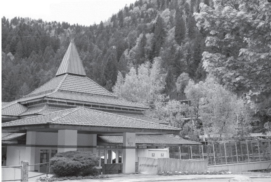
Fig. 2. Ingresso e corpo centrale dello stabilimento termale