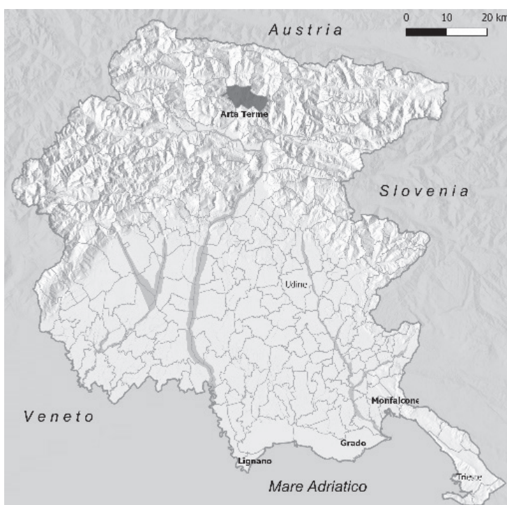
Fig. 1. Arta Terme e le altre stazioni termali in Friuli Venezia Giulia

Le prime notizie relative alla presenza di una fonte di acqua solforosa ( putens per l'intenso odore che emana 5 ) risalgono sicuramente al periodo romano. Già nel corso del I secolo a.C., le acque, infatti, con ogni probabilità venivano convogliate dalla fonte verso le vicine terme della importante stazione di Julium Carnicum (Zuglio), utilizzando delle condutture i cui resti sono oggi conservati