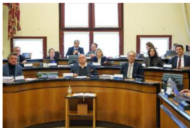
I banchi della Giunta veneta in Consiglio regionale