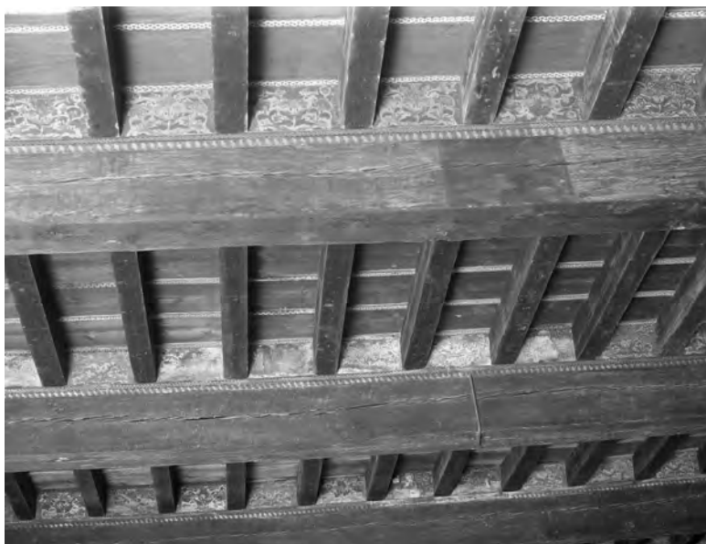
Fig. 10. Il soffitto ligneo della sala consiliare dopo il restauro, 1930. Si possono notare in secondo e terzo piano due delle tre pettenelle rinvenute raffiguranti la Madonna col Bambino realizzate nel 1471.