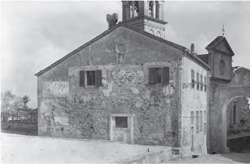
Fig. 2. Veduta del lato nord prima del ripristino, 1929.