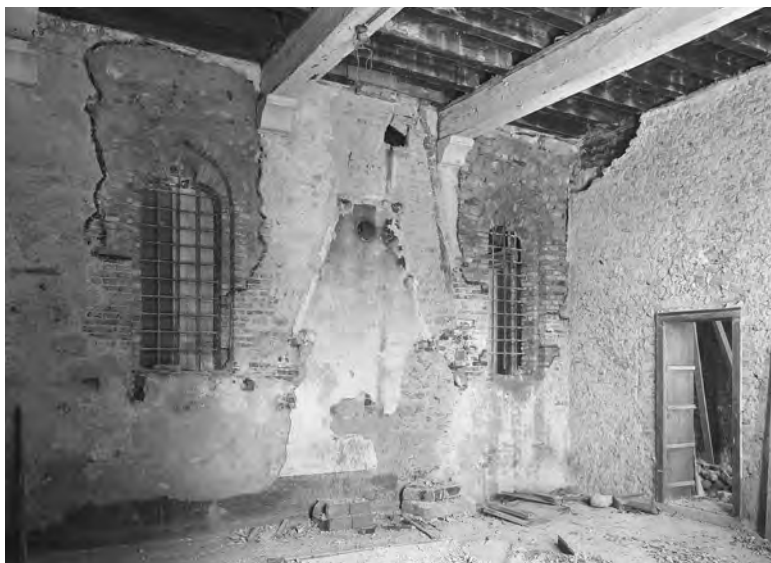
Fig. 6. Interno della parete est, 1929. La parte nord del muro con le tracce rinvenute del camino originario, durante i lavori di ripristino della sala del consiglio; a destra il tramezzo risalente al XIX secolo prima della demolizione.

destinato, molto probabilmente dopo che perse la sua funzione originaria in seguito alla soppressione della confraternita in età napoleonica e la sua sostituzione con la Fabbriceria di Santa Maria del castello. Dei due tramezzi in questione, quello con direzione est-ovest, realizzato in pietrame e sassi, è in parte visibile nelle fotografie antecedenti la sua demolizione avvenuta durante i lavori di ripristino del 1928-'29 (fig. 6), mentre il tramezzo con direzione nord-sud è ancora segnato in una planimetria del terzo quarto del XIX secolo al tempo in cui la Casa della confraternita era parte del presidio militare del castello e aveva assunto la funzione di Casa dell'Artiglieria 31 , ma fu demolito anteriormente al 1888, quando l'antica ex sala consiliare risulta già avere la fisionomia a due vani sopravvissuta fino al ripristino novecentesco 32 .