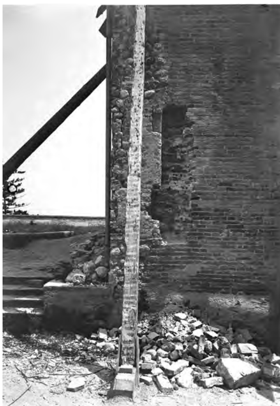
Fig. 5. L'angolo nord-ovest durante il ripristino, 1929 (SABAPUd, AF, ts003619).

nitiva, che allo stato attuale non vi sono evidenze che la superficie del terreno occupata dalla Casa fosse ingombra di edifici a essa anteriori.