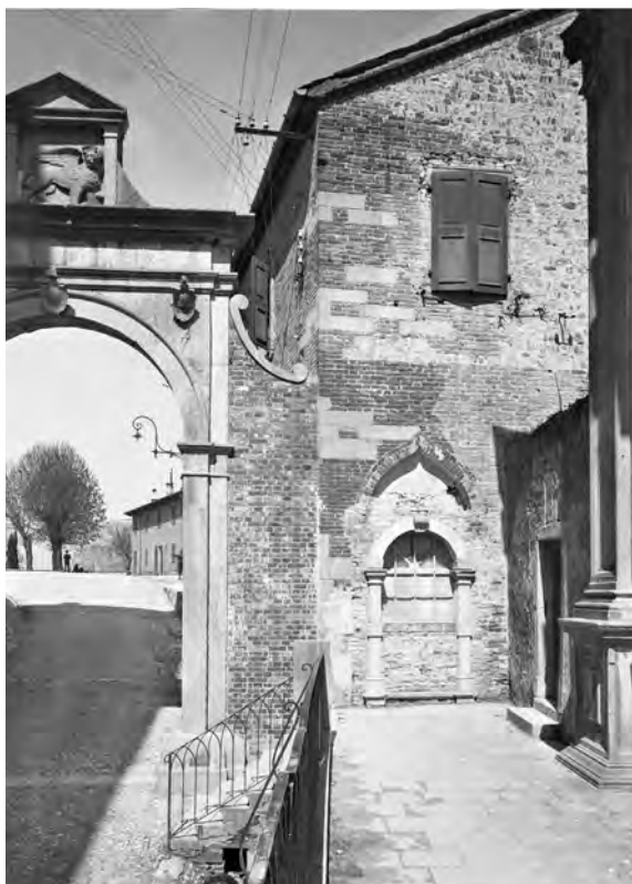
Fig. 3. Veduta del lato sud prima del ripristino, 1929.

di una fraternita che si occupasse di tali problemi 17 . Certo è che i suoi camerari si affiancarono a quelli della chiesa esercitando un ruolo via via preponderante fino a sostituirsi a questi ultimi e la confraternita ottenere dal consiglio comunale la gestione completa dell'antica pieve e del suo patrimonio nel 1443 18 .