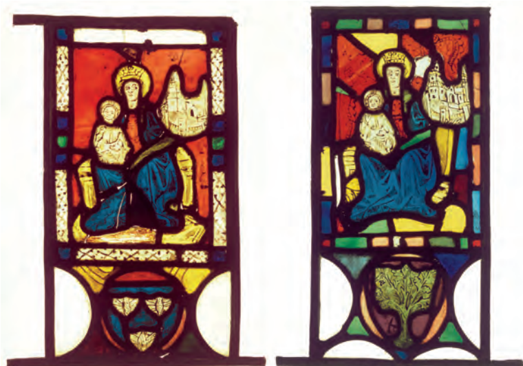
Fig. 14. Vetrate realizzate nel 1474 originariamente collocate alle finestre della sala del consiglio ai lati della cappa del camino (Udine, Civici Musei, AF, invv. OA 586a-b).

pieve, ed è presumibile che fossero state lì spostate dalla Fabbriceria dopo la soppressione della confraternita e la destinazione della sala del consiglio ad altri usi, dato che nella descrizione del 1848 già non risultano più essere nella Casa; furono traslate in Museo «a titolo di semplice deposito» nel dicembre 1908 102 . Ambedue le vetrate hanno nella parte inferiore un tondo in cui è inscritto un apparente stemma araldico, differente tra i due riquadri; tuttavia, non si è riusciti a stabilire un eventuale loro nesso con membri della confraternita, ed è anche possibile che siano meri elementi decorativi.