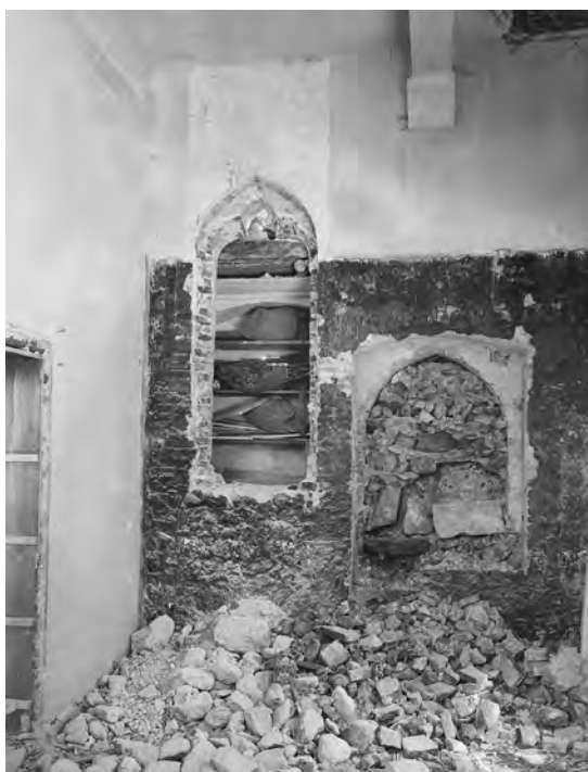
Fig. 7. Interno della parete est, 1929. La parte sud del muro durante la riapertura di una finestra e della porta originaria che conduceva al cortile esterno; notare tra i materiali di riempimento l'acquasantiera decorata a grandi foglie e protome umana.

ta sviluppandosi perpendicolarmente alla parete orientale 57 (fig. 15). Nella documentazione della fraternita gli unici presumibili cenni alla scala in questione, relativi a una sua non specificata modifica nel gennaio 1473 (dati i modesti importi potrebbe anche trattarsi di semplici riparazioni), lasciano supporre che inizialmente fosse in legno, visto