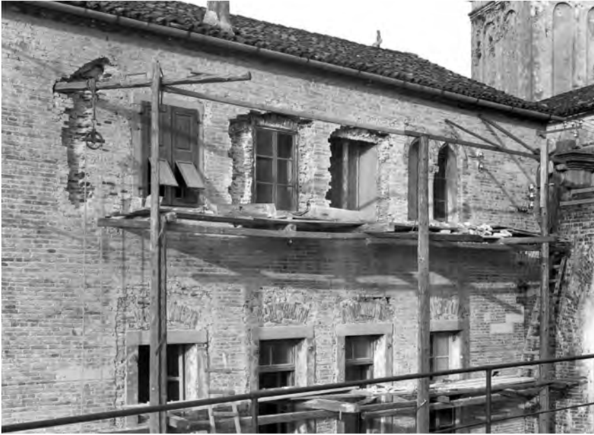
Fig. 4. Il lato ovest durante il ripristino, 1929.

note, non viene fatta collimare col dato archeologico più risalente del sito che colloca a dopo il 1365 il deposito di materiali di scarto e le strutture a esso collegate emersi al di sotto della Casa 24 .