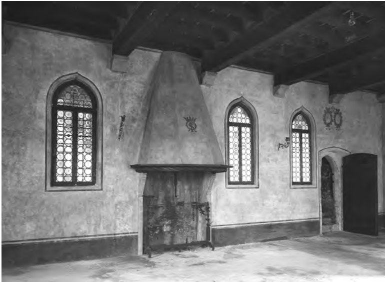
Fig. 12. Veduta verso est della sala del consiglio dopo il ripristino, 1930. Si noti sopra la porta la decorazione parietale originaria con gli stemmi di camerario e priore, l'unica allora presente su tale parete (SABAPUd, AF, ud003649).

la realizzazione del battuto si era provveduto a portare sul colle quanto per esso necessario tra calce, sabbia, laterizi frammentari e pietre, queste ultime, trattandosi di un pavimento a contatto del suolo, da ritenersi utilizzate per apparecchiare il vespaio 89 . Con tutta probabi-