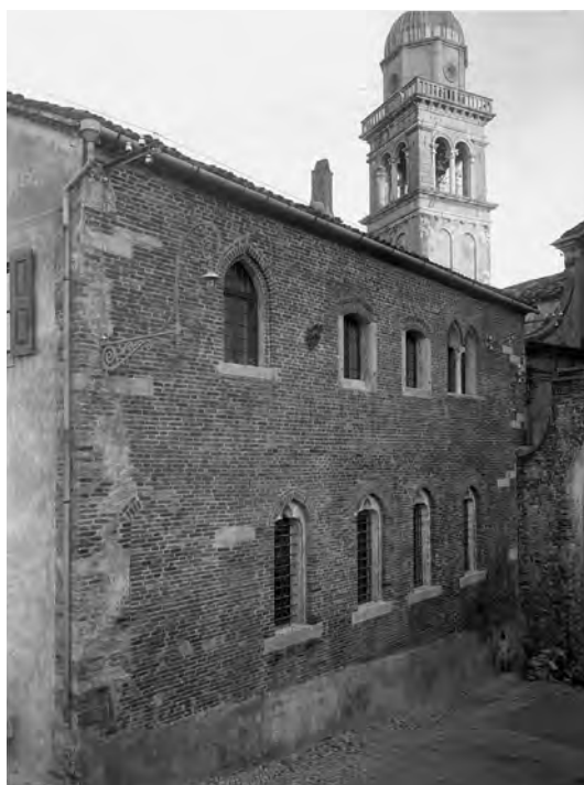
Fig. 9. Veduta del lato ovest a ripristino quasi ultimato, 1929. Notare il rifacimento delle finestre del piano terreno con arco lievemente inflesso e sott'arco trilobato, rispetto alla configurazione precedente con arco a sesto ribassato visibile in fig. 8 (SABAPUd, AF, ud003540).

cento nel vano della porta era stato inserito un portale in pietra con arco a tutto sesto, visibile prima del ripristino parzialmente murato e trasformato in finestra 62 . Ristabilita la funzione primitiva dell'in-