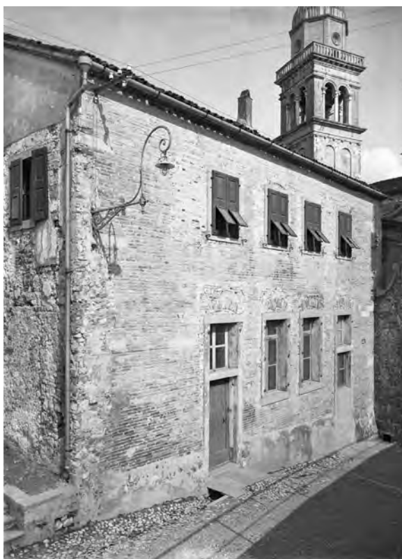
Fig. 1. Veduta del lato ovest prima del ripristino, 1929.

stessa 8 . Così è, per esempio, nel caso della donazione dell'1 aprile 1292 di Giacomina detta Maura, moglie del fabbro Federico, creduta essere l'attestazione più antica della congregazione, ove nel registro compare