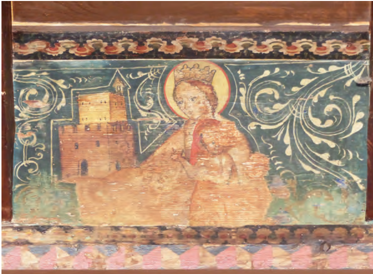
Fig. 11. Soffitto ligneo della sala consiliare, stato attuale (2025). Particolare della pettenella realizzata nel 1471 raffigurante la Madonna col Bambino e il modello del palazzo patriarcale.

tre furono trovate ancora al loro posto durante i lavori del 1928-'29, e in una tra esse la Madonna con una mano sorregge il modello tridimensionale del palazzo patriarcale di Udine 80 (fig. 11). L'artista è verosimilmente il pittore e intagliatore Battista da Tolmezzo, membro della confraternita di Santa Maria del castello che lavorerà ancora nella Casa e nel 1478 eseguirà, sempre su incarico della fraternita, l'ancona di San Marco per l'altare omonimo nella chiesa di San Rocco 81 .