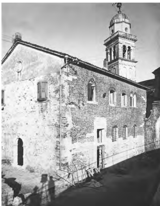
Fig. 8. Veduta da nord-ovest a ripristino quasi ultimato, 1929. Si noti la similitudine tra le finestre del piano terreno e del primo piano; sul lato nord è stato messo in opera il portale con arco a tutto sesto che prima si trovava nel lato sud.

ta granda» del piano terreno 60 , con arco inflesso originario (anch'esso terzo tipo ruskiniano) nella cui lunetta nel marzo 1518 fu realizzata dal pittore Tommaso una Santa Maria di cui si vedono indecifrabili residui nelle fotografie più risalenti 61 . Nella seconda metà dell'Otto-