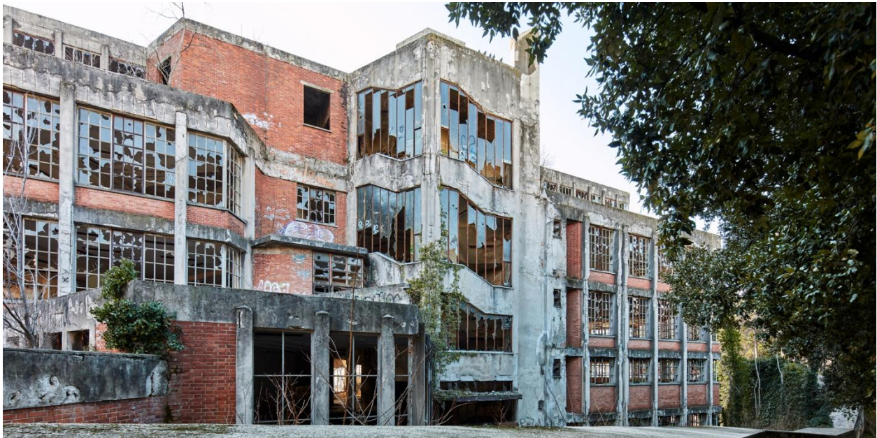
Fig. 1 Marcello d'Olivo, Prospecto su via Carli (1957) (Archivio D'Olivo, Gallerie del Progetto, Civici Musei di Udine).