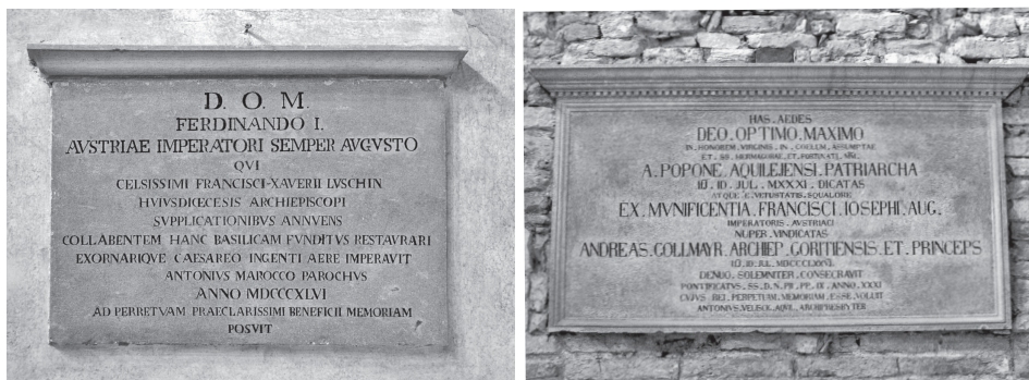
1-2. Le lapidi nella basilica di Aquileia che ricordano i restauri fatti eseguire dagli imperatori Ferdinando I e Francesco Giuseppe.

tore Ferdinando I dopo una visita effettuata con l'imperatrice Marianna di Savoia nel 1844 6 (figg. 1, 2).