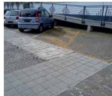
02 | Parcheggio accessibile di una struttura sportiva e residenziale per studenti; le soluzioni tecniche appaiono inefficienti rispetto ai requisiti d'uso richiesti (foto C. Conti).

Moreover, analysing with stakeholders the accessibility of places and services, some evaluations have been made on the social systems to support the families and, referring to experiences provided by Daily Centres such as, for example, the Protected Laboratory of the National Association of the Families of the Visually Impaired - A.N.Fa.Mi.V. an NGO of Udine we started to thinking about new possible models of cohabitation. In this research, the objective of the participation is intended as an opportunity of collection of the functional needs, it was transformed, then, in a further opportunity of verification of the close relationship existing between accessibility and the environmental quality also in the case of the residency, and it has allowed to identify some elements of convergence between the inclusive design practice (careful to the requirements of the customers with visual perception deficit)