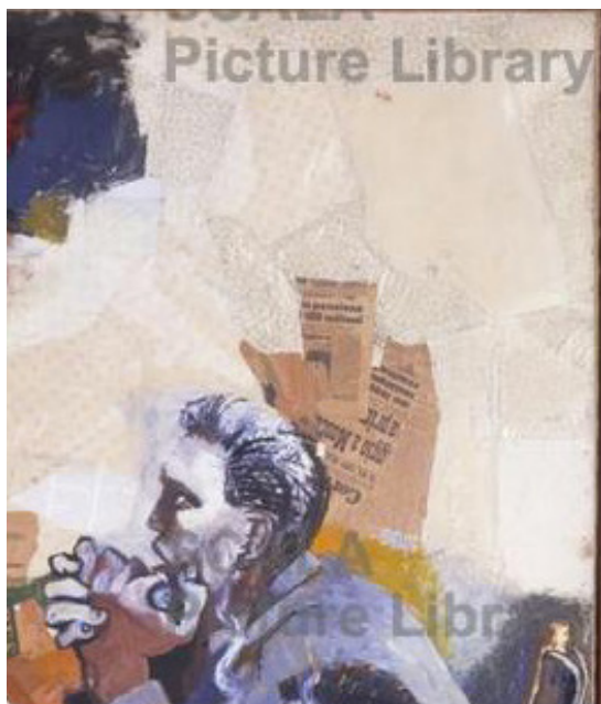
1. Renato Guttuso, La discussione , 1959-1960, Londra, Tate Gallery