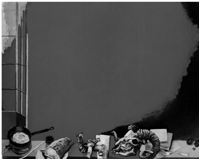
3. Renato Guttuso, La nuvola rossa , 1966, Berlino, Nationalgalerie, Staatliche Museen zu Berlin

allora, automaticamente, entro nello spazio di Burri» 23 . Alla fine degli anni Sessanta Burri appariva come uno snodo essenziale, un termine di confronto e di misura. Dal suo lavoro si poteva andare verso la pittura (come aveva suggerito Guttuso) oppure sperimentare l'oggetto «povero», indifferenziato, collocandolo entro lo spazio reale (come stavano cercando di fare Kounellis e Pascali). Quest'ultima possibilità si scontava, però, con lo smarrimento di quel senso del limite tanto ammirato dalla generazione di Argan (e di Guttuso), e che per i giovani dell'arte povera restò un problema di difficile risoluzione. Forse, a pensarci bene, mai interamente risolto 24 .