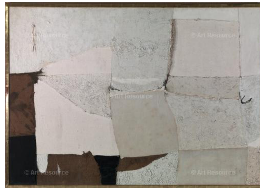
2. Alberto Burri, Composizione in bianco , 1955, Buffalo, Albright-Knox Art Gallery

sua importanza sono quelle meno evidenti. Fu infatti la prima edizione a porre concretamente una limitazione degli invitati per poter assegnare loro uno spazio maggiore. C'era voluto qualche anno, ma ormai il problema dell'individualità del singolo artista, e dunque della necessità di una documentazione più ampia ed esaustiva del lavoro, rispetto al modello delle tradizionali costipatissime collettive, era ormai avvertito 16 .