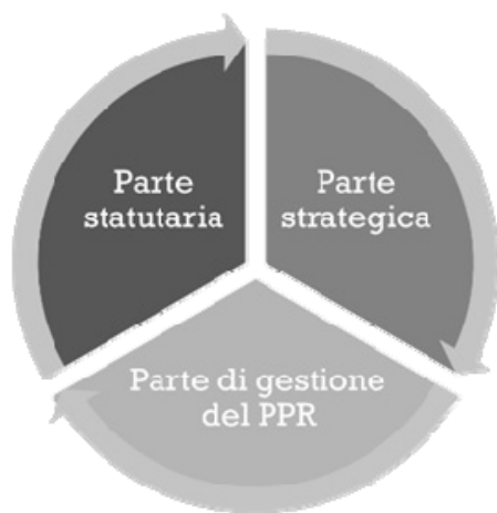
Fig. 1. La struttura tripartita del Piano Paesaggistico Regionale del Friuli-Venezia Giulia (elaborazione degli Autori).

La fase attuale di avvio di alcuni progetti sperimentali per l'adeguamento degli strumenti urbanistici locali al PPR propone nuove opportunità in termini di co-interessamento e coinvolgimento delle comunità locali, in particolare immaginando progettualità di paesaggio a scala sovracomunale, dimostrando l'importanza delle dinamiche orizzontali che pongono in dialogo territori contigui per disegnare i paesaggi del domani (Fig. 1).