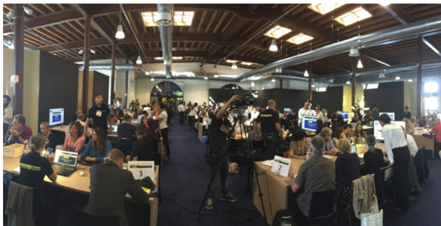
Fig. 3.2. Svolgimento delle discussioni tra i partecipanti nei tavoli di lavoro.

tavolo di lavoro, proiettare le slide, distribuire il materiale e far rispettare i tempi, garantendo a tutti un'equa possibilità di partecipare alla discussione.