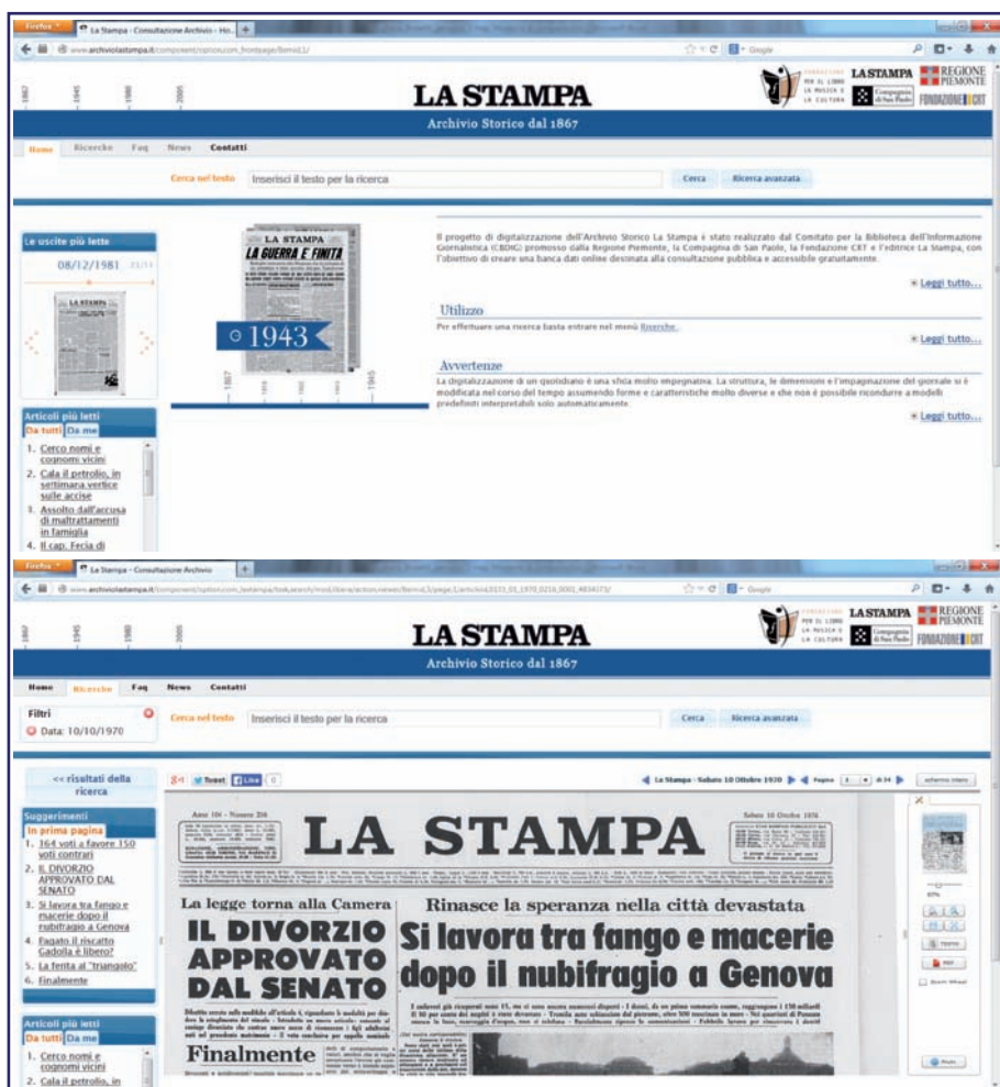
Fig.2 Home page e presentazione dei risultati di una ricerca effettuata nell'Archivio Storico La Stampa: www.archiviolaStampa.it

La Stampa di Torino è uno dei maggiori quotidiani italiani e uno dei più longevi. Viene fondato il 9 febbraio 1867 con il titolo Gazzetta piemontese , per diventare poi La Stampa nel 1895. Il giornale nel corso degli anni affronta varie vicissitudini, diventando nel 1926 di proprietà della FIAT. Nel dopoguerra la testata muta in La Nuova Stampa per segnare la discontinuità con il periodo in cui si era dovuta allineare al regime, per poi riprendere in modo definitivo il nome La Stampa nel 1959.