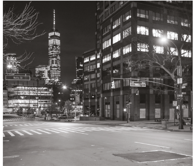
05. NYC Pandemic 4-6-14, 2020.

nuova comprensione dei risvolti temporali e fisici che queste strategie possono produrre.