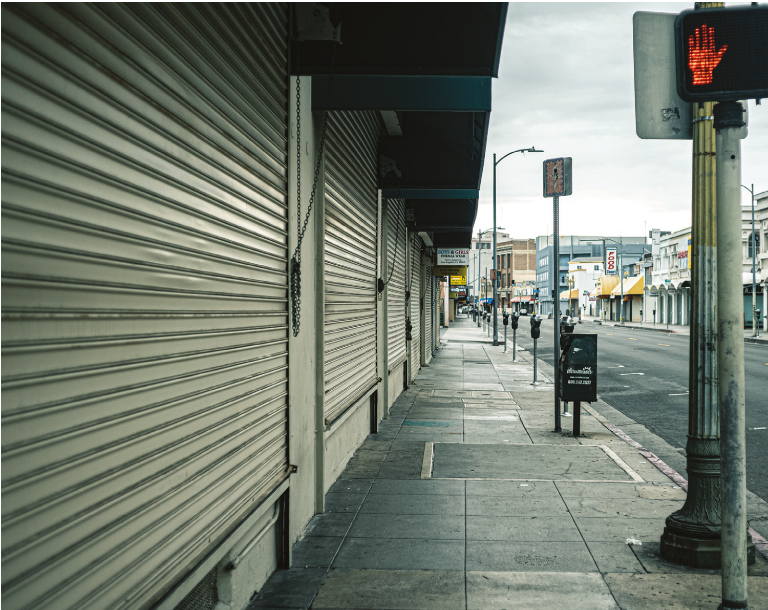
01. Pandemic LA 003, 2020.