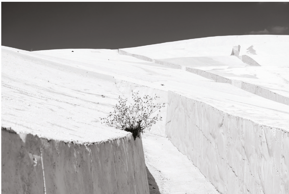
03. Cretto contro cielo, 2017.

ponendo due estremi futuribili: il primo vede una scomparsa della città, quale palinsesto stratificato di architettura, società ed eventi, per la perdita dell'esigenza di prossimità fisica che era stata all'origine della sua costruzione. Urbs e civitas sono infatti due elementi indissolubili e imprescindibili nella costruzione di uno spazio urbano.