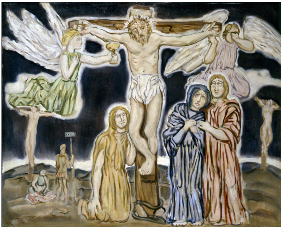
Figura 2. Tullio Garbari, Cristo in croce. Calvario . 1931. Olio su tela, 73,5 × 92 cm. Ca' Pesaro – Galleria Internazionale d'Arte Moderna.