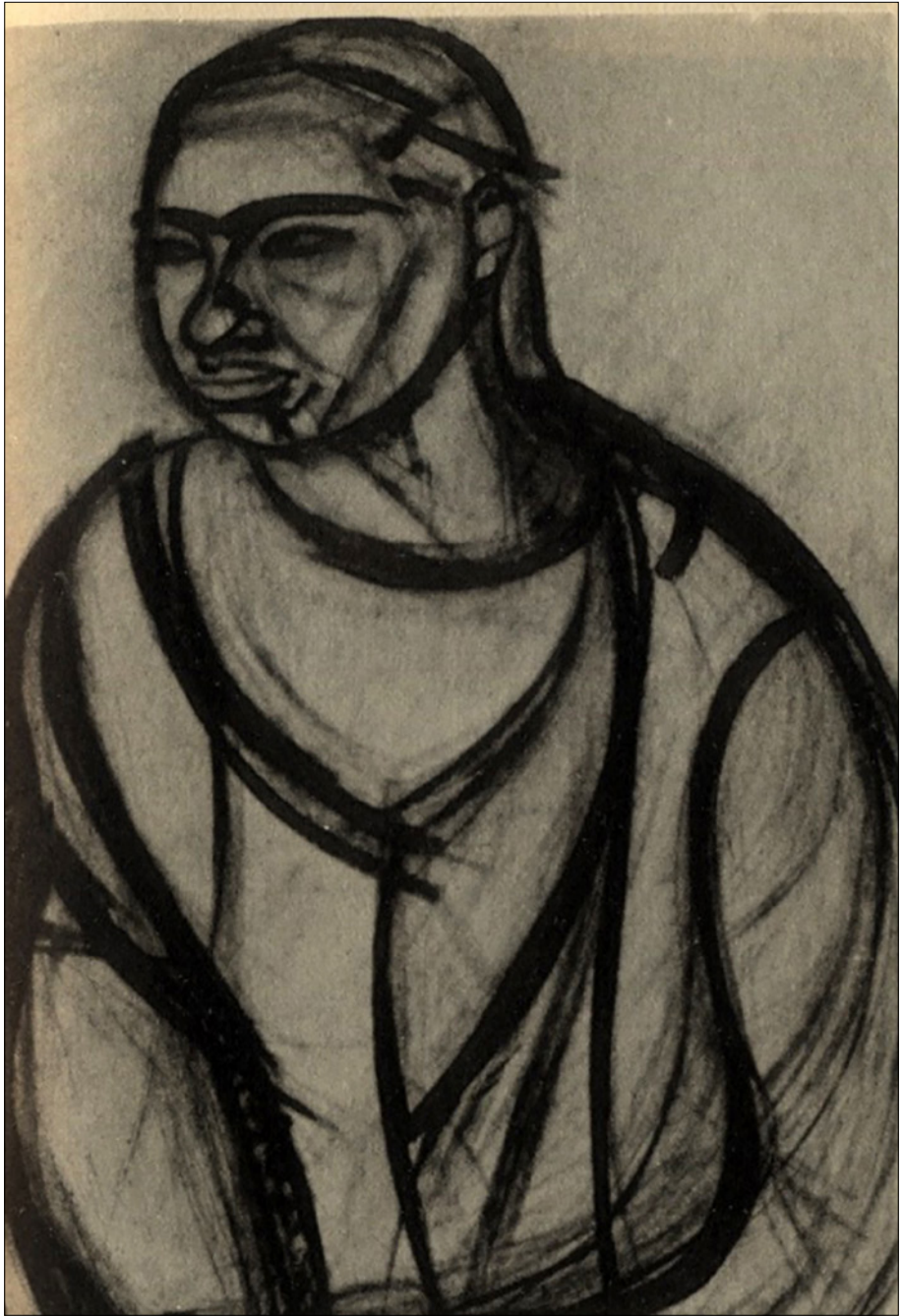
Figura 1. Gino Rossi, Educanda . Foto da Catalogo dell'Esposizione di Ca' Pesaro del 1919